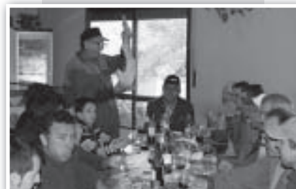
Por último... Todos juntos a disfrutar de un buen almuerzo.