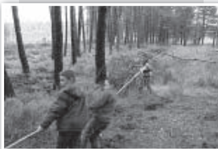
Ya limpio, hay que arrastrar el pino hasta un tractor.