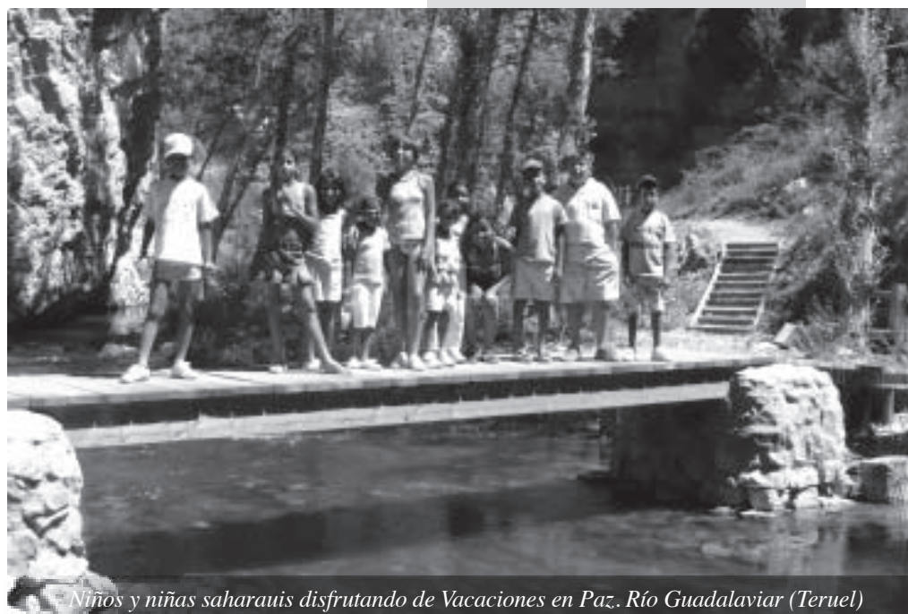
Niños y niñas saharauís disfrutando de Vacaciones en Paz. Río Guadalaviar (Teruel)

Asociación Lestifta Amigos del Pueblo Saharaui en Teruel