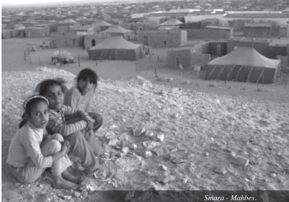
Smara - Mahbes.

¿Podría un árbol crecer sin raíces?. Todos diríamos que no, que es imposible, sin raíces un árbol no podría obtener alimento ni permanecer anclado a la tierra. De la misma manera ocurre con la cultura y los pueblos. Los pueblos serían el árbol y sus culturas las raíces que alimentan estos pueblos y los dotan de una identidad que resulta fundamental para el crecimiento y desarrollo de cada uno de los individuos y de dichos pueblos.