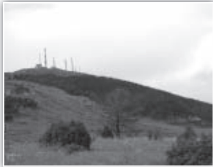
Excursión por la zona quemada de Castelfrío

quemada de Castelfrío. De la mano del COLECTIVO SOLLAVIENTOS pudieron comprobar los daños causados por este gran incendio, la fortaleza de la naturaleza que mostraba sus primeros brotes de recuperación y escuchar las explicaciones de estos expertos que, de manera altruista, dedicaron su tiempo y esfuerzo en acompañarnos por distintos rincones de la sierra.