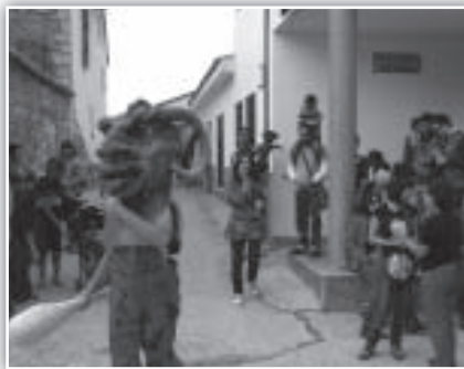
Los cabezudos recogen a los niños del pueblo..

A la una, el colorido de la plaza se desbordó pues los chicos de TOMBS CREATIUS (Cataluña) montaron –a modo de presentación– algunos elementos de su propuesta "COLORES DE MONSTRUO", encantador despliegue de juegos infantiles.