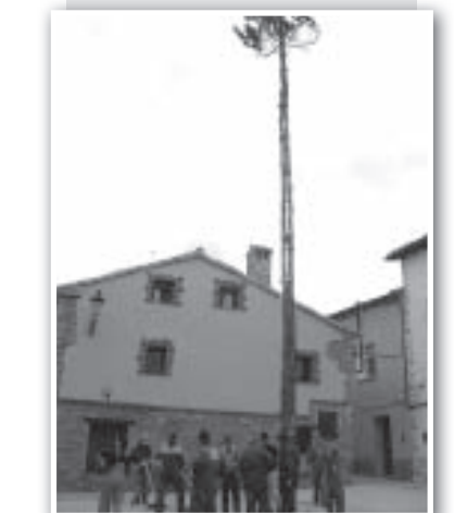
... para que luzca majestuosa durante las fiestas.