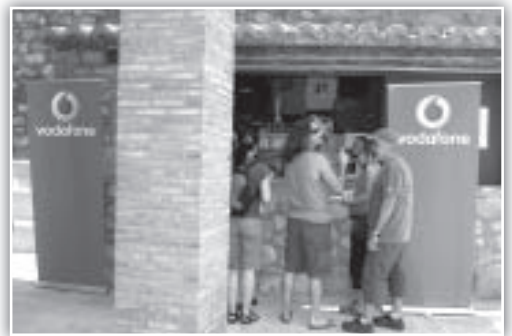
Vodafone, patrocinador del concurso de fotos.