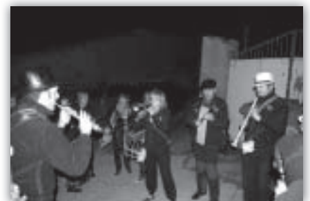
Alarifes en un momento del Encuentro de Gaiteros.

Entre los contratiempos de última hora fue la clasificación del equipo de España para los cuartos de final del mundial de fútbol lo que obligó a combinar la afición futbolera con el encuentro de gaiteros. La mezcla, lejos de resultar rara, fue del agrado de todos pues parecía que estábamos en el mismísimo campo de fútbol. La pantalla instalada por Paco "Nogue" y Álvaro "El Molinero" permitió seguir el partido animado por las piezas tradicionales que ejecutaban los componentes de ALARIFES, ESFURIA TRONADAS y DULZAINEROS DEL GUADALOPE.