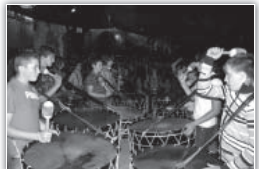
Actuación de Tambores de Teruel en la plaza.