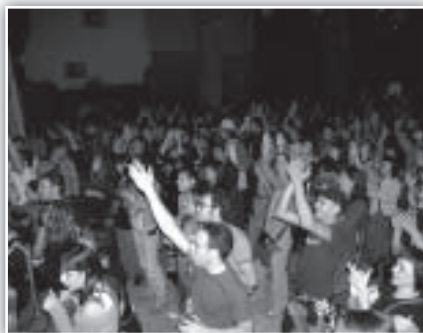
Ambientazo con Acquaragia Drom.

trepidante, lleno de ritmo, humor y, sobre todo, calidad. Su increíble mezcla de Klezmer y aires gitanos nos transportó a todos a una fiesta colectiva de la que era absolutamente imposible escapar.