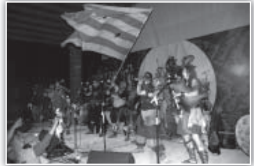
Lurte sobre el escenario de Poborina Folk.