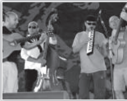
"Sandokan" de Acquaragia con el trío AiAiAi.