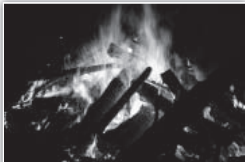
Todo en Poborina sucede al amparo de la magia de la hoguera de San Juan.

combinando actuaciones de los más pequeños con otras de los mayores para terminar tocando sus respectivos toques de exhibición. Pese a que acuden al festival desde su primera edición, no dejan de congregarse a un numeroso público siendo, año tras año, una de las actuaciones más esperadas.