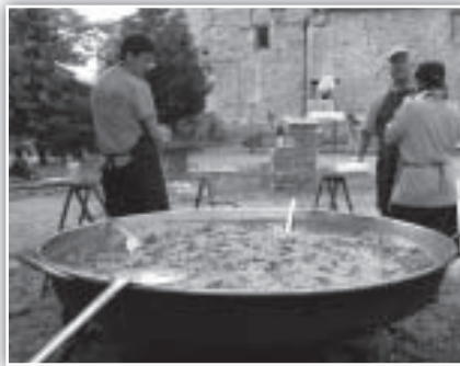
La gente de "Pastores" en plena faena...