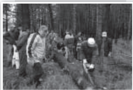
... y se limpia quitándole las ramas bajas, dejando solo "la capota".