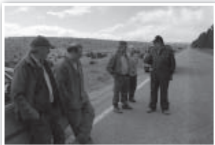
Una semana antes de san Juan vamos todos al monte...

Quando llegas a Poborina por primera vez, te sorprende ver en medio de la plaza un enorme pino plantado. Es, ni más ni menos, que "la lata", un costumbre ancestral seguramente ligada a ritos primaverales precristianos y que aquí, como en muchos otros lugares, todavía se conserva. "Lata" es el palo donde se cuelgan embutidos y jamones para que se curen. Llamar "lata" a semejante árbol da una idea del talante atrevido de las gentes de El Pobo, esa forma de ser que hace posible cada año Poborina Folk. A modo de "fotonovela" –y gracias a las fotos que nos ha facilitado Luis Prieto– os acercamos a esta costumbre tan antigua como arraigada.