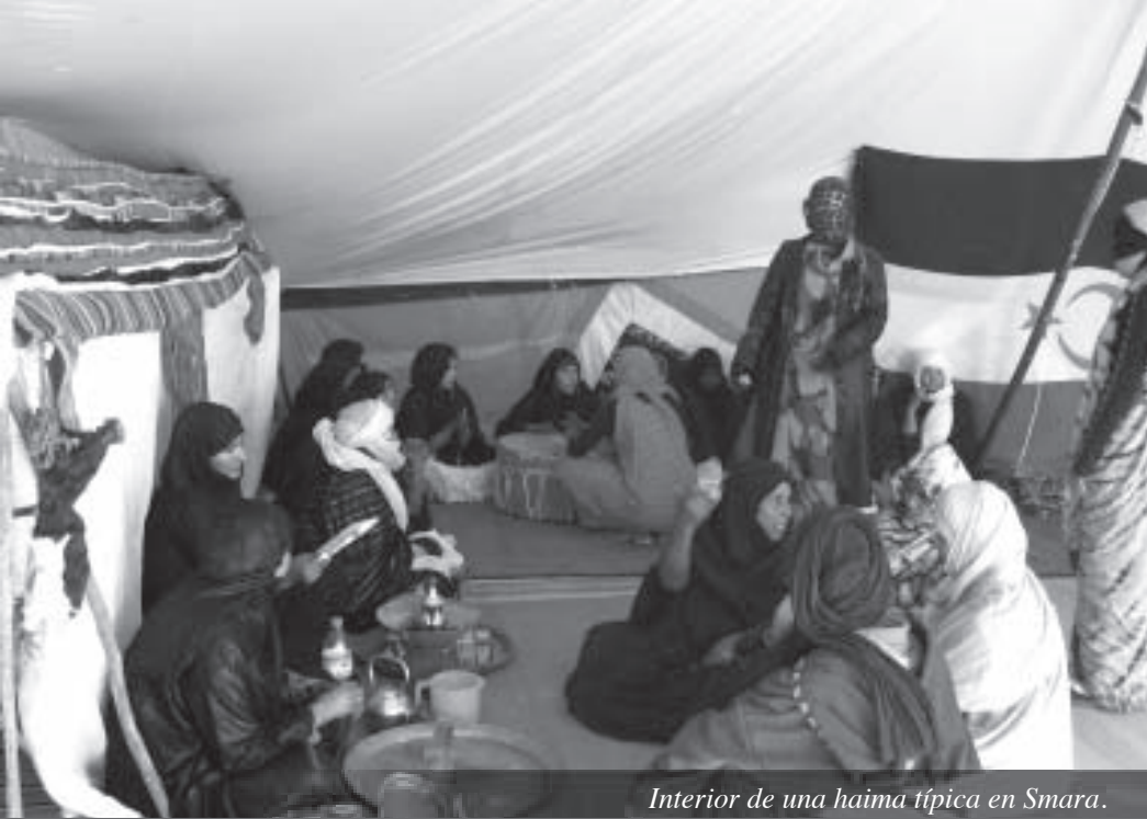
Interior de una haima típica en Smara.