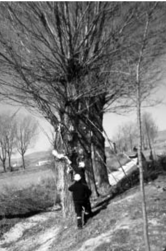
Alumnos del Taller de Empleo podando los chopos.