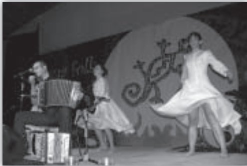
Magnífica propuesta de Korrontzi sobre el escenario.