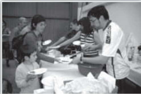
La "Comisión" trabajando hasta el último momento.