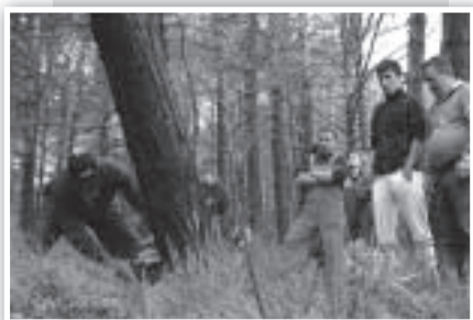
... se corta con cuidado para que no dañe a otros pinos...