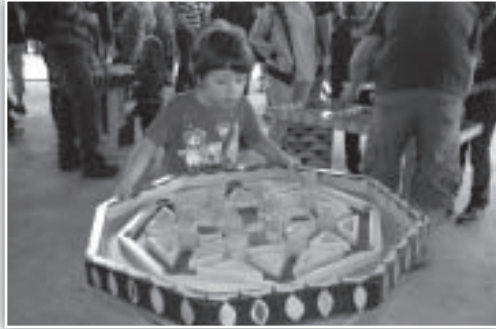
Niños y mayores disfrutaron de "Colores de Monstruo"