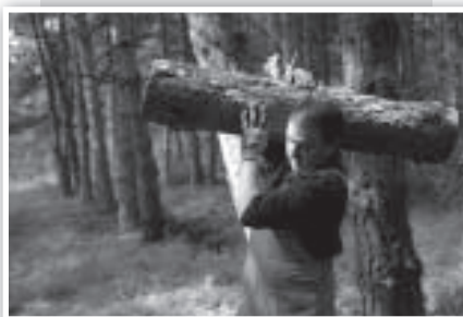
... los mozos...