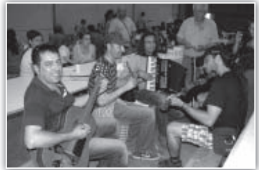
Improvisada Jam-Session a los postres...