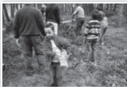
Todos trabajan para recoger la leña que sobra. Trabajan los nanos...