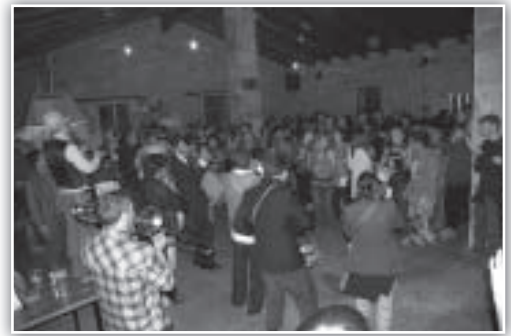
La Transfronteliere del Amor tocando en “El Horno”