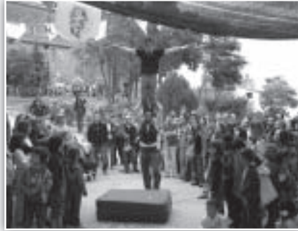
Tandarika en la plaza del ayuntamiento.