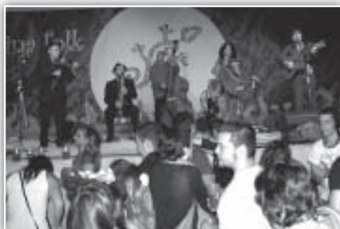
Acquaragia Drom, desde Italia hasta Poborina.