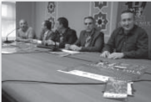
Rueda de prensa de presentación de la XII Edición de Poborina Folk. Sede de la Comarca "Comunidad de Teruel"