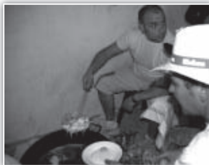
Y antes de seguir, a reponer fuerzas...

A las once de la noche, los TAMBORES DE TERUEL (Aragón) comenzaban su estruendosa actuación en la plaza del ayuntamiento para permitir que terminaran con tranquilidad sus pruebas de sonido los grupos de la noche. En esta ocasión, presentaban una formación mixta de niños y adultos, impresionante grupo que sobrepasaba el medio centenar de tambores y bombos. Ejecutaron parte de su repertorio