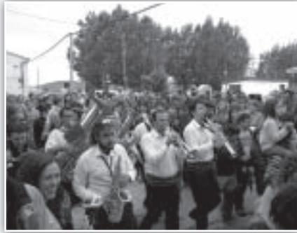
Numeroso público siguió a Tandarika por las calles.