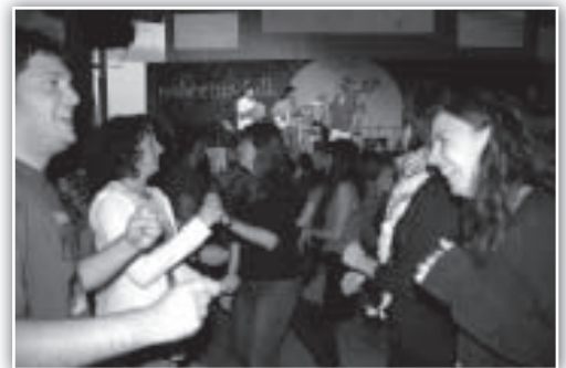
Bailando ritmos castellanos con Hexacorde.