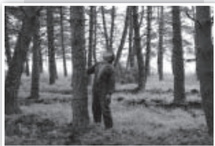
... escogemos un pino alto alto y majo majo...