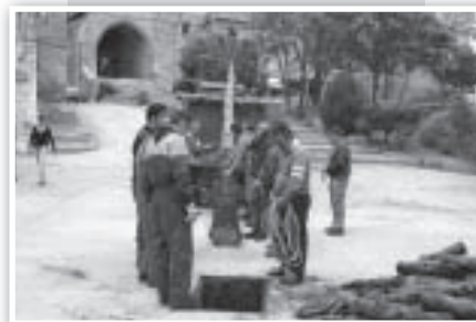
Luego hay que plantarla en la plaza...