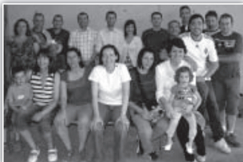
Los voluntarios de la "Comisión".