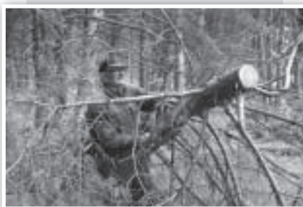
... y los mayores. Con esta leña, haremos la hoguera de san Juan.