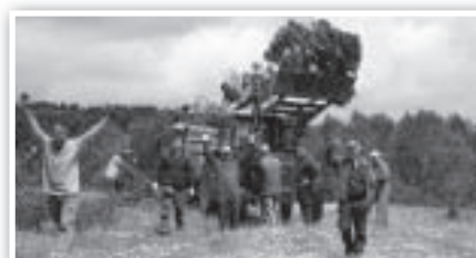
Una vez en el tractor... ¡AL PUEBLO CON LA LATA!