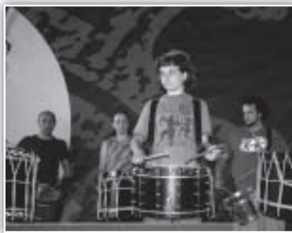
Tambores de Teruel cerró el Trébede Clandestino.