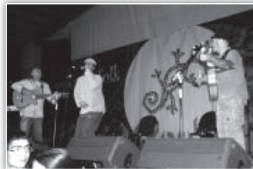
AiAiAi, lo mejor de la rumba catalana para cerrar.

Para finalizar, otra estupenda propuesta. La doceava edición la cerraba el trío AI AI AI! (Cataluña), que con su particular visión de la rumba catalana nos mantuvo bailando hasta pasadas las cinco de la madrugada. Magníficos músicos –formaron parte de la banda